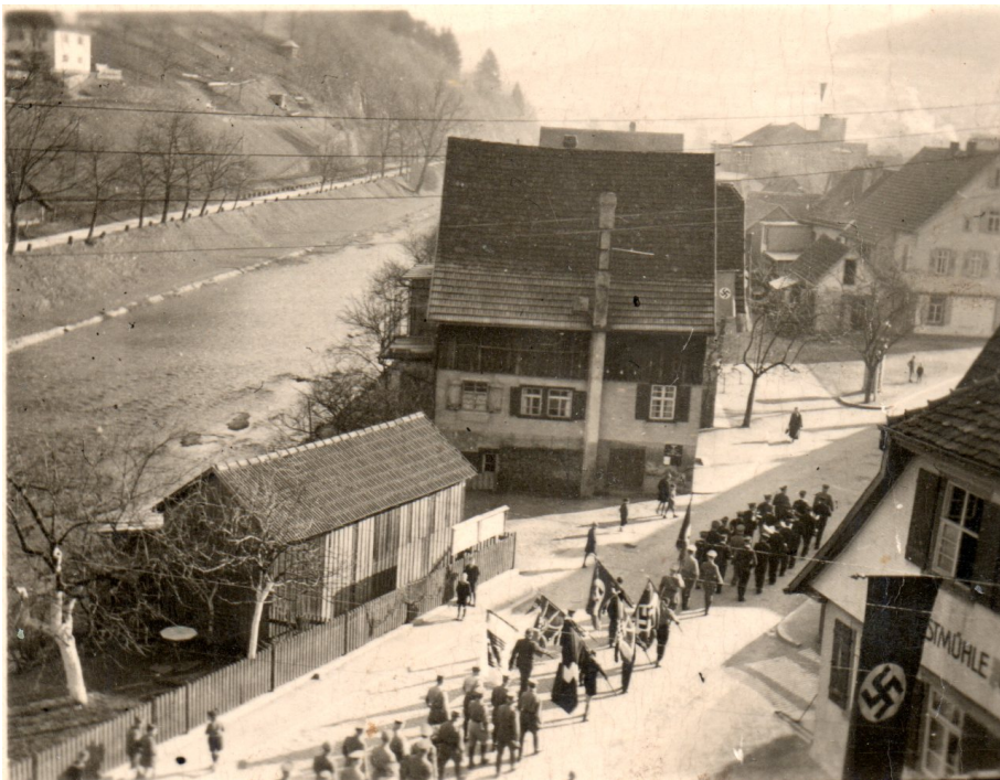
NS-Umzug in der Schiltacher Hauptstraße, 1941. Bernard wohnte im Haus hinten rechts.

Wie viele seiner Landsleute war er ein Opfer des am 1. September 1939 entfesselten Kriegs. Als Offiziersanwärter geriet er in deutsche Gefangenschaft, doch entzog das NS-Regime den polnischen Soldaten den Schutz des Genfer Abkommens von 1929, das die menschenwürdige Behandlung der Kriegsgefangenen gebot. Man machte sie zu rechtlosen „Zivilarbeitern“, die Zwangsarbeit verrichten mussten und diskriminierende Vorschriften bekamen, so ein „P“ auf der Kleidung und Kontaktverbot mit Deutschen. Grund war die nationalsozialistische Rassenideologie: Für sie waren Polen „minderwertig“ und gehörten zu den „Untervölkern“. War ihr Einsatz in Landwirtschaft und Fabriken kriegsbedingt nicht zu vermeiden, so musste die „Blutreinheit“ des „Herrenvolks“ vor ihnen geschützt werden. Konsequenz war ein Befehl, der ihnen verbot, „mit deutschen Frauen in Verkehr zu treten“. Falls doch, war dies ein „GV- (Geschlechtsverkehr-) Verbrechen“, das sie unter schärfste Strafen stellte.