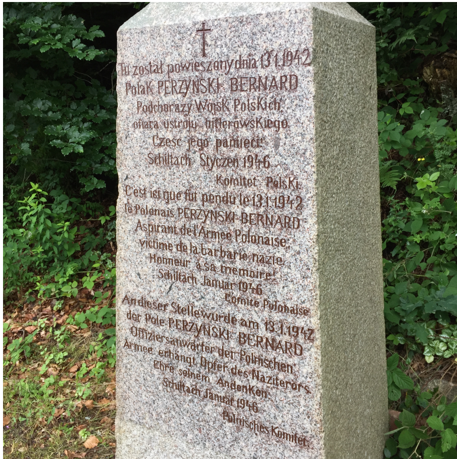
Der Polenstein am Schiltacher Gründlebühl