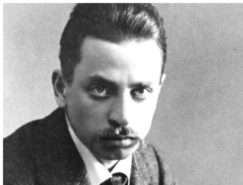
Rainer Maria Rilke

Gleich zwei Jubiläen gibt es für den großen und populären Dichter Rainer Maria Rilke (1875-1926). Sein Geburtstag jährt sich 2025 zum 150. Mal und 2026 ist sein hundertster Todestag. Rilke zählt nicht nur weltweit zu den bedeutendsten Autoren des 20. Jahrhunderts; laut Robert Musil war er sogar „der größte Lyriker, den die Deutschen seit dem Mittelalter besessen haben!“. Auf jeden Fall war seine Wirkung gewaltig. Grund genug, dass die beiden Freunde der Literatur diesem Dichter auch in Schiltach einen Abend widmen.