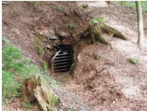
Ob. Hunersbach, Foto: Klaus Wolber