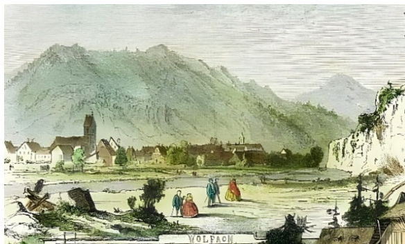
Blick auf Wolfach – aus der „Illustrierten Zeitung“, 1861.

Der Referent beschäftigt sich seit über 40 Jahren intensiv mit der Geschichte seiner Heimatstadt Wolfach, erhielt 2006 den 2. Landespreis für Heimatforschung des Landes Baden-Württemberg und die Ehrenmedaille der Stadt Wolfach für sein Buch über die Wolfacher Fasnet, war zwischen 2006 und 2010 maßgeblich an der Sanierung des Wolfacher Heimatmuseums beteiligt und arbeitet seit 2012 als Archivar im Gengenbacher Stadtarchiv.