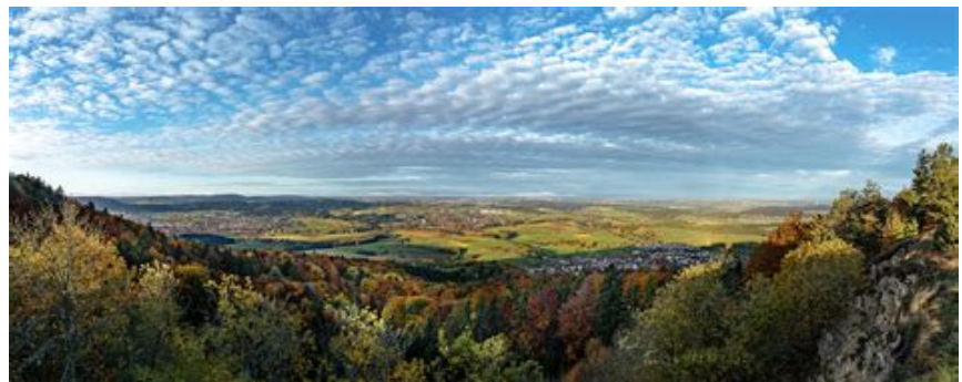
Blick auf die Baar

Die Landschaft der Baar gehört zu den ältesten Siedlungsräumen des deutschen Südwestens. Aus der Hallstattzeit zeugt das Fürstengrab auf dem Magdalenenberg (um 616 v.Chr.) bei Villingen, aus der Römerzeit das Auxiliarlager Brigobanne bei Hüfingen. In der Hochmulde der Baar fließen bei Donaueschingen die Schwarzwaldflüsse Brigach und Breg zur Donau zusammen.