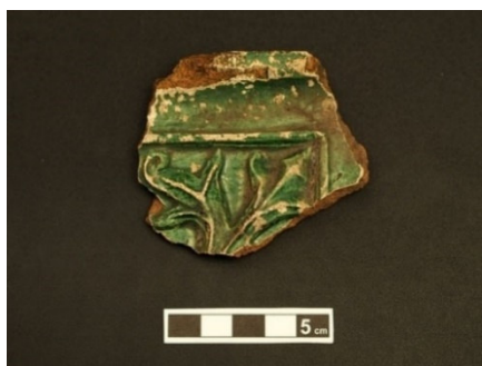
Bruchstück einer Ofenkachel vom ehemaligen Schiltacher Schloss

In ihrem Vortrag gehen sie auf die mittelalterliche Siedlungslandschaft um Schiltach ein. Sie berichten über archäologischen Baustellenbeobachtungen in Schiltach und Schenkenzell und über Funde, die sie im Bereich einer Hofwüstung im Reichenbächle und einer bei Wittichen gemacht haben. Sie stellen des weiteren Funde aus der Region vor, z. B. von der Burg Schiltach, der Burg Wittichenstein, der Klingenburg und dem Schloßle bei Schenkenzell.