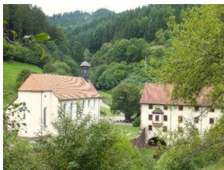
Was vom ehemaligen Kloster erhalten blieb

19.00 Uhr im Klostersaal, Kloster Wittichen, Schenkenzell. Es bewirbt die Pfarrgemeinde Wittichen.